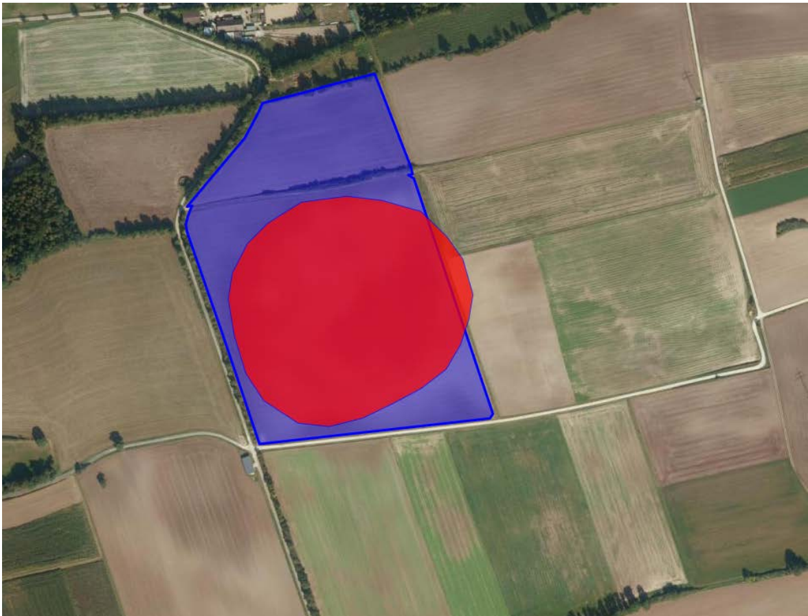
Abbildung 5 - Bodendenkmäler (tiefrot)

Für die weitere Planung wird davon ausgegangen, dass das Denkmal nicht existent ist.