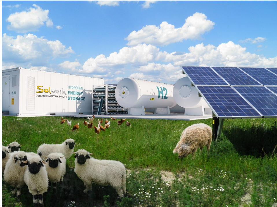
Abbildung 2 - Sinnbild Agrovoltaik (© Solwerk GmbH 2020)

Wie viele andere Branchen steht auch die Landwirtschaft vor der Herausforderung ihren Platz im 21. Jahrhundert zu finden und auch der nachfolgenden Generation noch eine Perspektive bieten zu können.