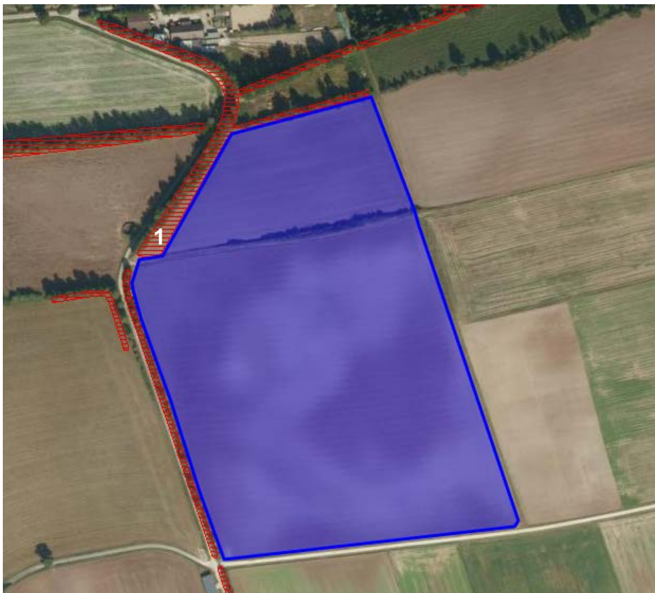
Abbildung 4 - Angrenzende kartierte Biotope