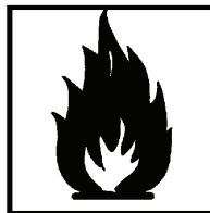
F+ - hochentzündlich F - leichtentzündlich