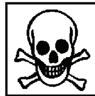
T+ - sehr giftig T - giftig und/oder krebserzeugend