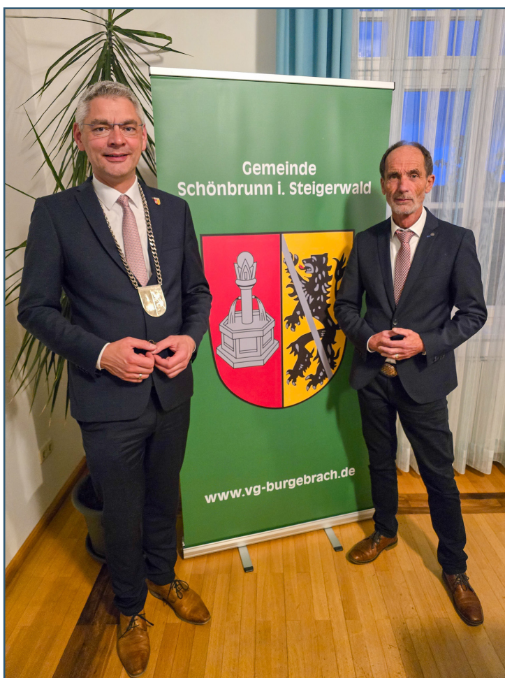
Erster Bürgermeister Dirk Friesen mit Zweitem Bürgermeister Hubertus Bickel