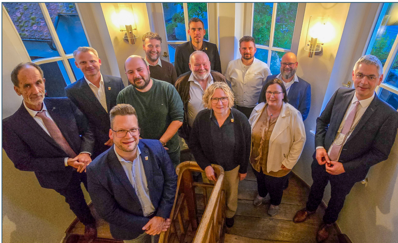
Der neue Gemeinderat Schönbrunn i. Steigerwald 2026 - 2032