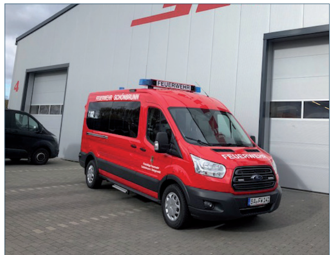
NEUES MTW FÜR FFW SCHÖNBRUNN