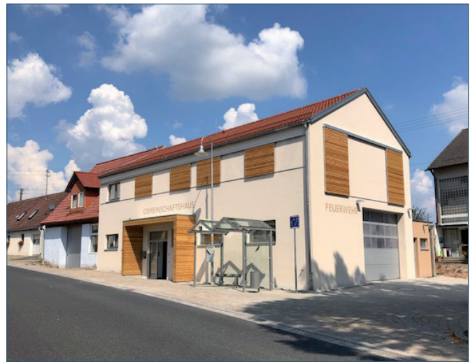
FEUERWEHR- UND DORFGEMEINSCHAFTSHAUS FRENDSHOF