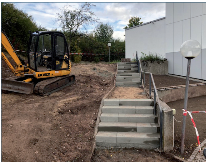
AUSSENANLAGEN SPIELPLATZ - SCHULE