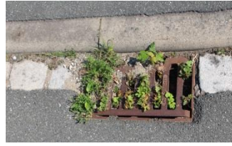
Straßeneinlauf ist stark verunreinigt und verwuchert: Eine Überschwemmung ist vorprogrammiert