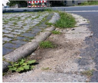
Durch Verunreinigung und Bewuchs wird der Abfluss hier stark gehemmt.