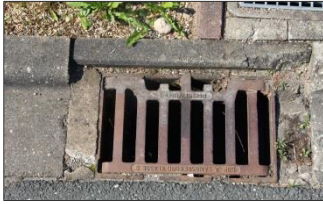
Gepflegter Straßeneinlauf: Der Abfluss von Regenwasser ist gewährleistet