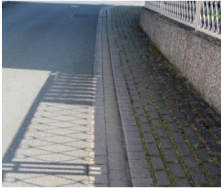
Gepflegte Flussrinne: Das Regenwasser kann ungehindert zum Straßeneinlauf fließen.