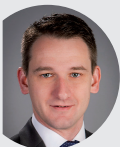
Johannes Maciejonczyk 1. Bürgermeister Markt Burgebrach

Ich freue mich, dass dieser wichtige Baustein schulischer Bildung unter Federführung des Landratsamtes Bamberg erfolgreich angepackt wird.